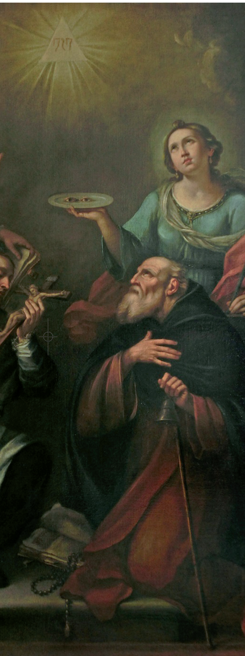
Tela di S. Lucia (Girolamo Montanari)