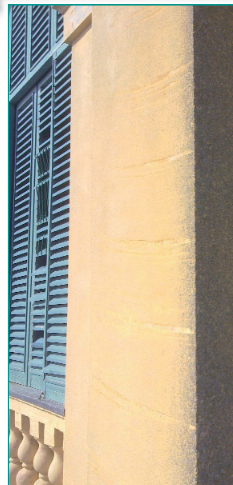
I finestroni del campanile

Vi invito a preparare un luogo nella casa con una tovaglia bianca, un'immagine sacra, dei fiori, una candela, le uova segno tipico della Pasqua di Nostro Signore. Per chi desiderasse anche una busta segno di una partecipazione alla vita della Chiesa. Il ricavato delle vostre offerte andrà alla sistemazione delle finestre del campanile che già da tempo denunciano la loro trasandata condizione. Io entrò nelle vostre case con l' acqua benedetta segno del Battesimo che tutti abbiamo ricevuto per rinnovarlo, ma anche segno della potenza di Dio che vince il male per proteggere le nostre dimore e coloro che vi abitano, le nostre attività e la nostra vita in comune. Vi porterò come sempre anche un ricordo della visita. Sono stato in Perù nei mesi scorsi e ho chiesto che venissero confezionati dei piccoli rosari con i quali abbiamo contribuito per 2000 euro alla costruzione di un asilo nido. Quando uscirò dalle vostre case e dall'incontro con voi, sarete voi a benedire, con la vostra preghiera, me e tutti i missionari.