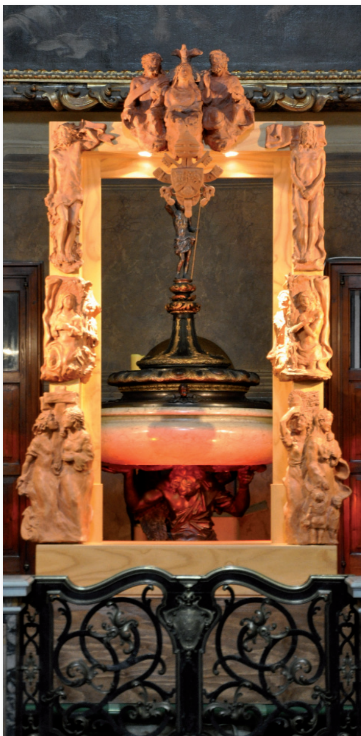
Cattedrale di Bologna: scultura "Porta fidei" di Luigi Mattei

Il Papa, recentemente, ha scritto un documento intitolato: " Porta fidei ", la porta della fede. Anche il cammino della fede è cominciato quando una porta si è spalancata.